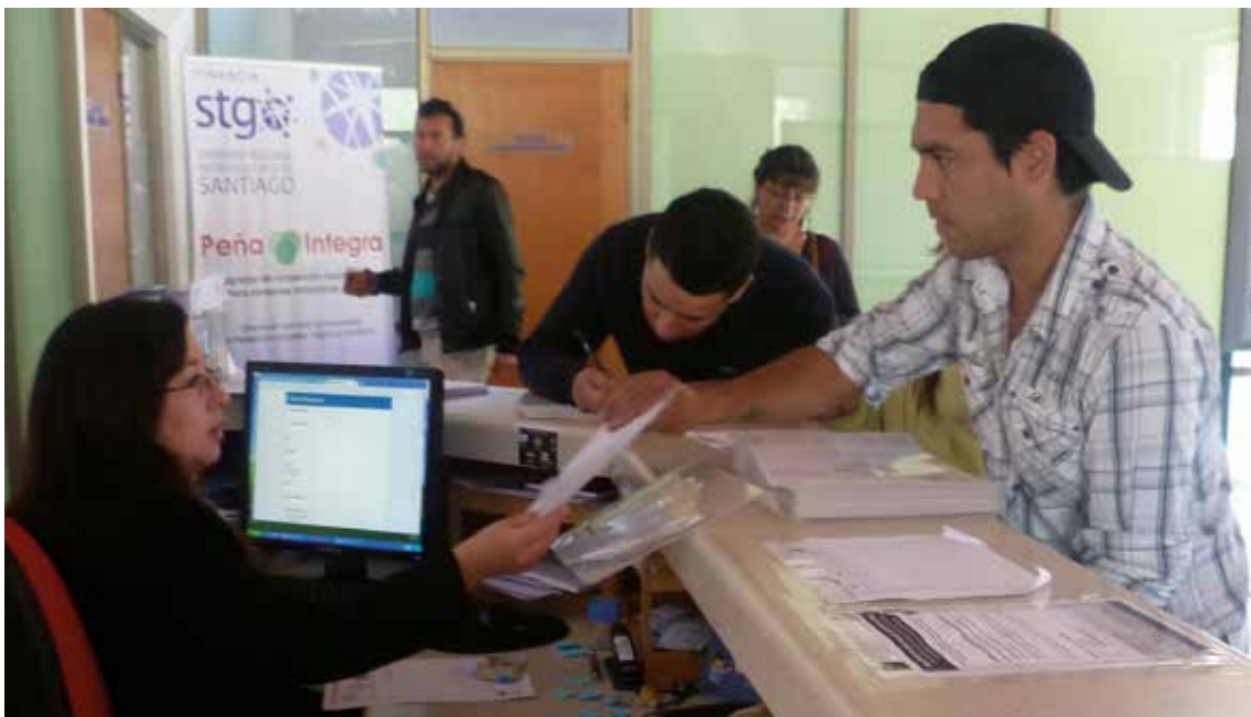
The Yunus Centre addresses the district's economic development and poverty. To implement this new form of economic development, a cultural change within municipal government was initially required, together with new ways of working together across departments.

El principal desafío de la implementación de esta nueva forma de desarrollo económico fue el cambio